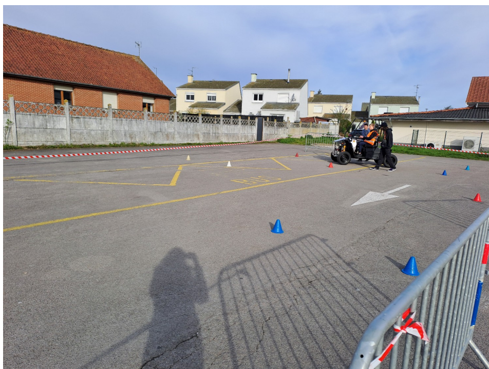
Essai d'une voiture électrique créée par les élèves du LP Dégrugillier.

80 776 g de CO 2 pour le trajet soit en moyenne 1 324.1g de CO 2 .